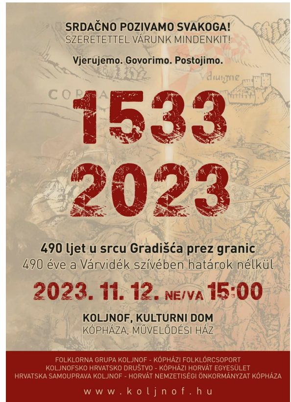
Rukom napišen plakat iz 1983. ljeta na priredbu i plakat 2023 ljeta Kézzel írott plakát 1983-as rendezvényre és a plakát 2023-ban