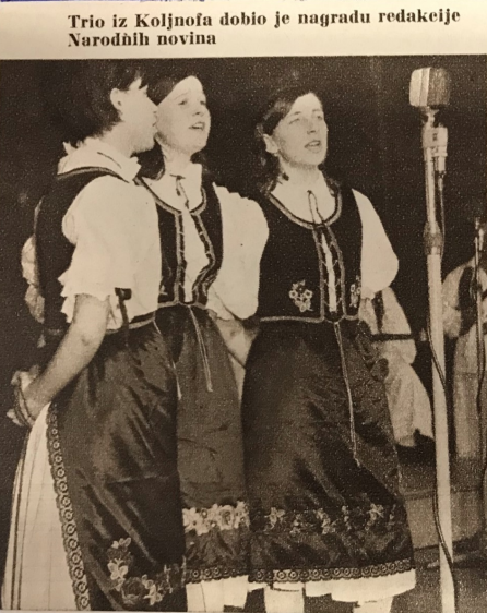
Trio iz Koljnofa dobio je nagradu redakcije Narodnih novina