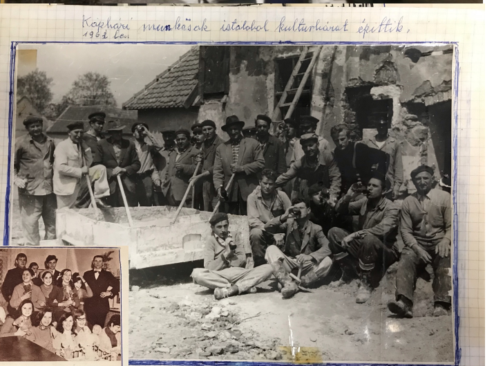
Kópházi mura-kašak istatobal kulturházat építtek, 1962. évi