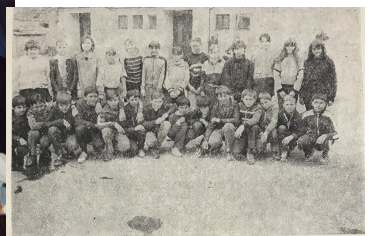
Učenici VI. razreda Mladi Koljnofci