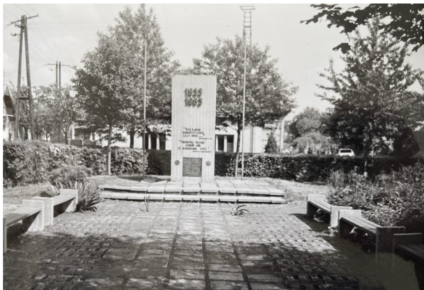
Spomenik koga su postavili 1983. Ijeta Az 1983-ban felállított emlékmű