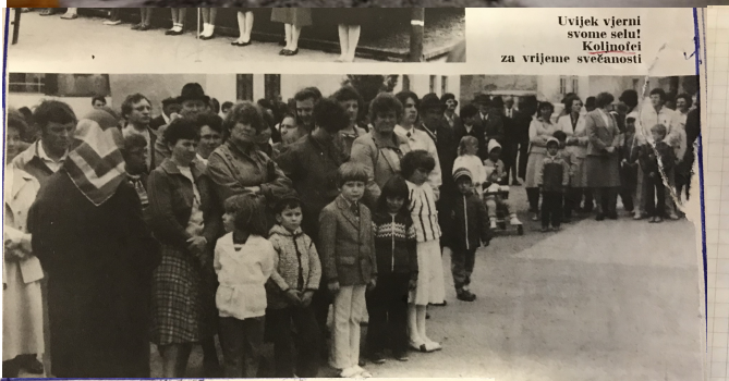
Uvijek vjerni svome selu! Koljnofci za vrijeme svečanosti