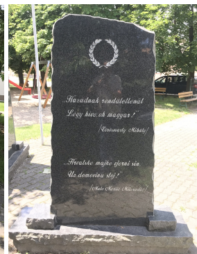
Novi spomenik u spomenparku zajedno sa spomenikom za plebiscit u 1921. Ijetu.