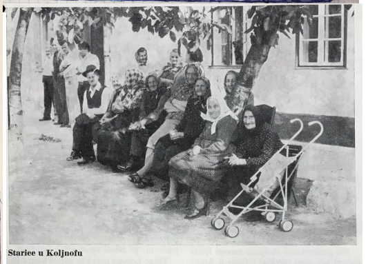
Starije u Koljnofu