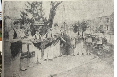
Pionirski tamburaški orkestar